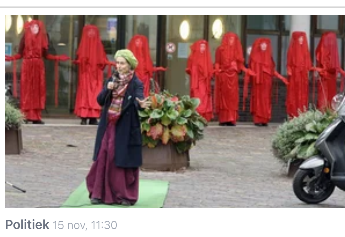
Politiek 15 nov, 11:30 'Klimaatacties halen bestuurders uit hun bubbel'