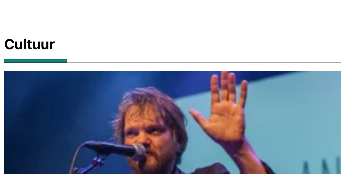
Cultuur 16 uur geleden Smutfish geeft jubileumconcert in Luxor