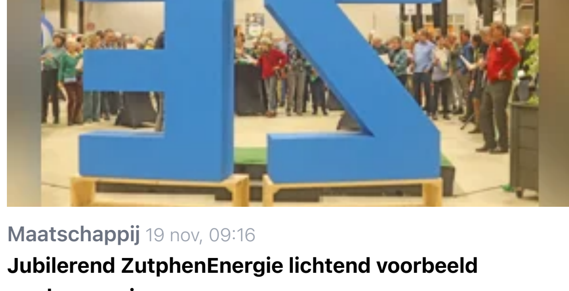
Maatschappij 19 nov, 09:16 Jubilerend ZutphenEnergie lichtend voorbeeld verduurzaming