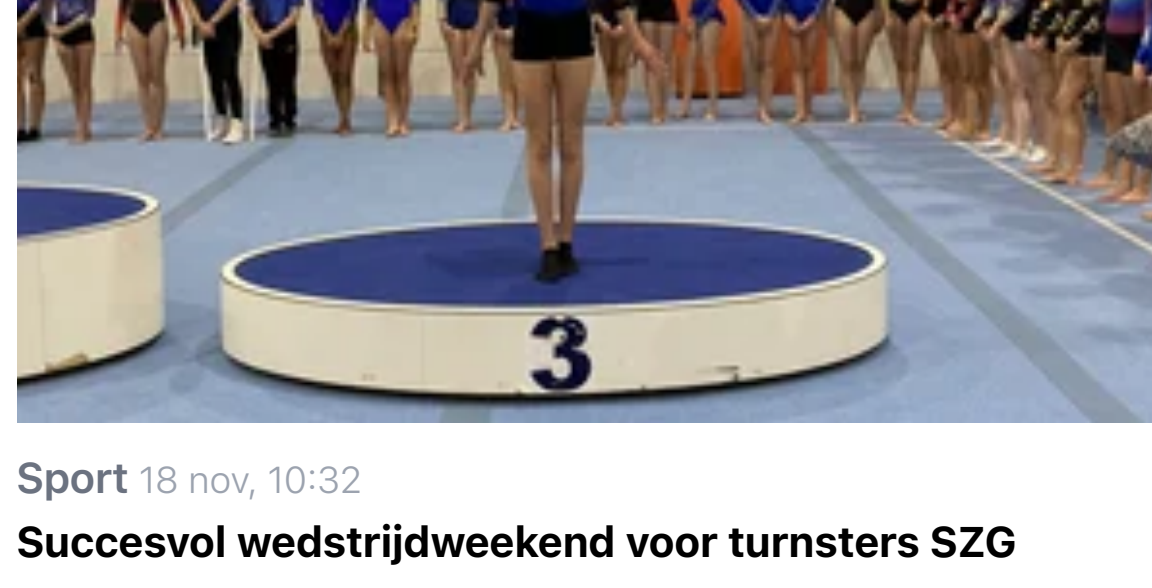
Sport 18 nov, 10:32 Succesvol wedstrijdweekend voor turnsters SZG