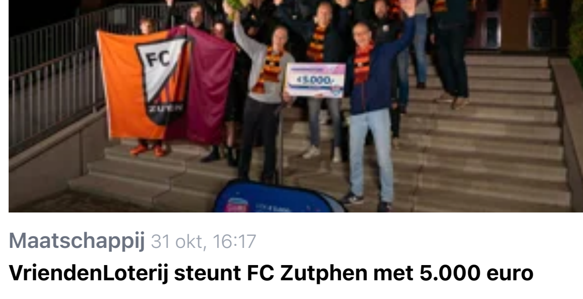
Maatschappij 31 okt, 16:17 VriendenLoterij steunt FC Zutphen met 5.000 euro