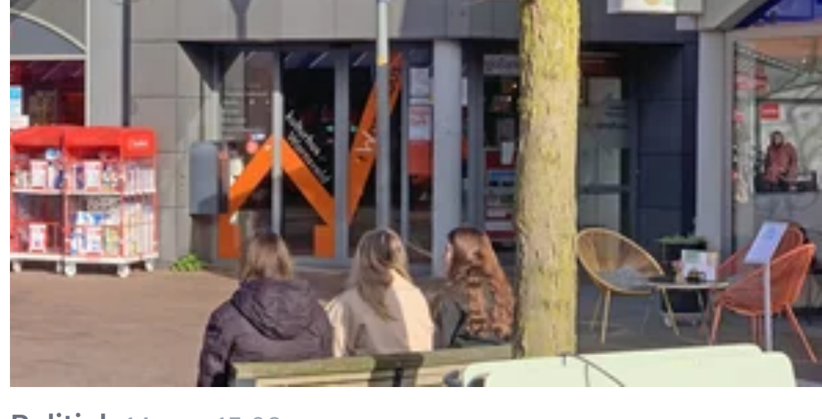
Politiek 14 nov, 15:03 'Warnsveld laat ons hart sneller kloppen'