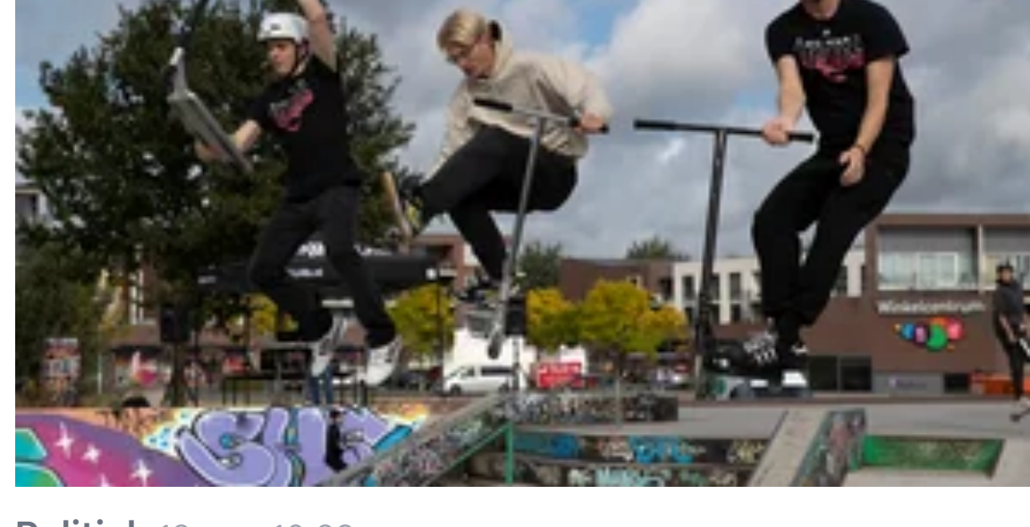
Politiek 12 nov, 10:29 'Evenementenbeleid beter afstemmen op jongeren'